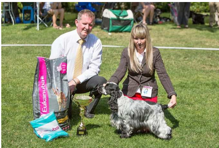
HCH MACAMBÓ MR. MACHO - výborný 1, CAC, BOV, Víťaz ŠV pes, BOB