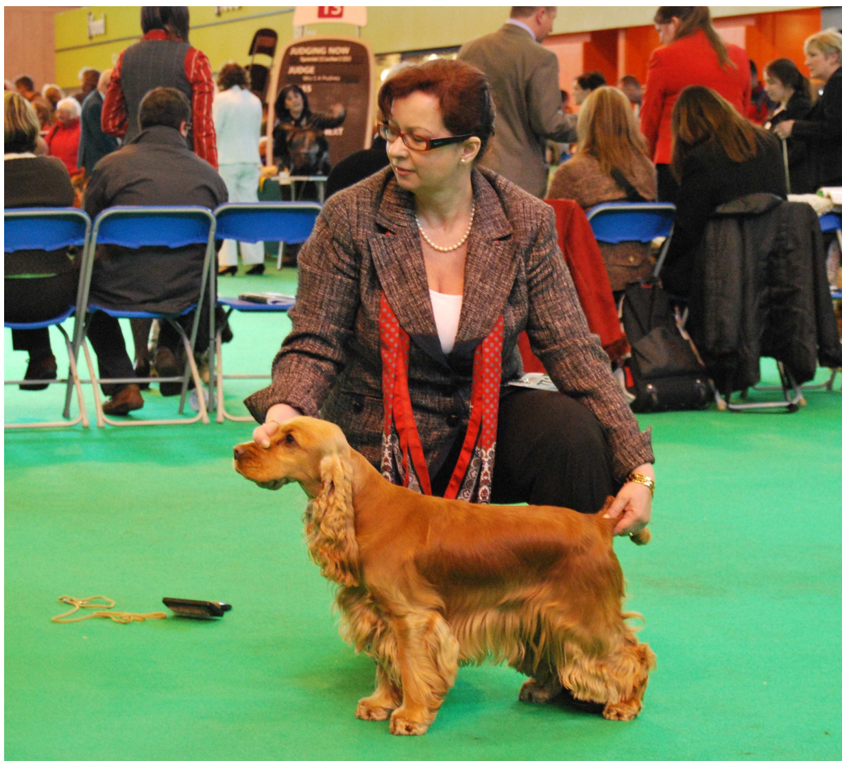
CRUFT´S 2010 - IVORY IVY zo Zámockého parku – VHC – Yearling Bitch