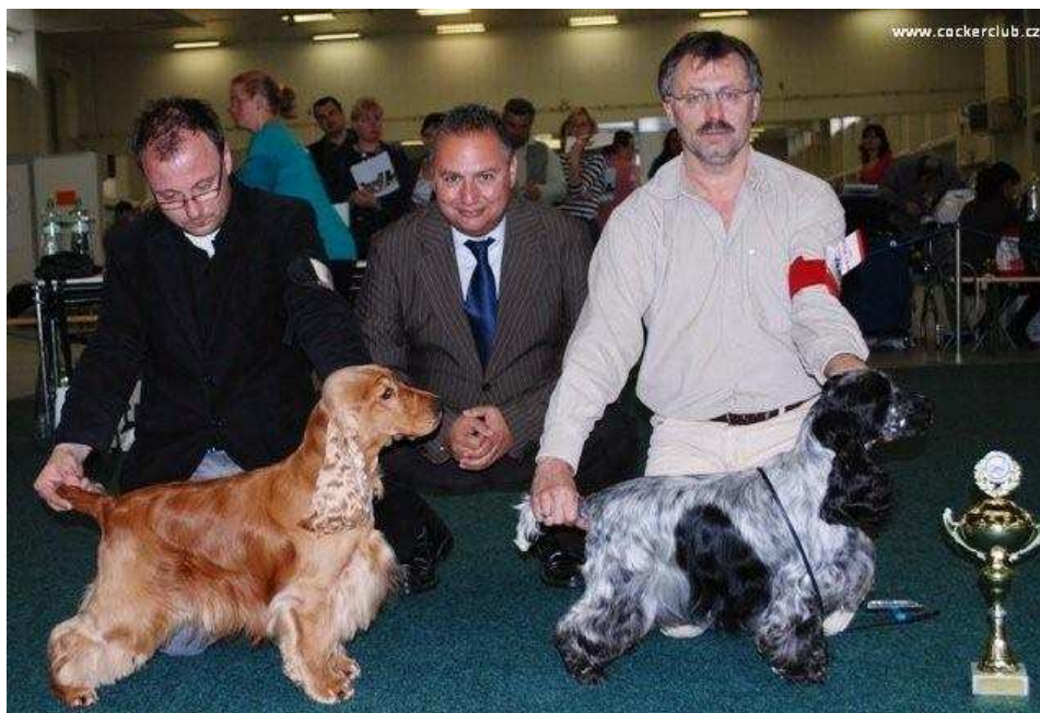
SW Costopa's FOREVER MAD & SW, BIS SPACY Black Petrs

Psov sa prihlásilo nad očakávanie – zrejme vďaka pozvanému rozhodcovi z exotickkej krajiny, ale tiež možnosti získať 3x CAC (CAJC) počas jedného víkendu. Po ukončení uzávierky sa počet prihlásených psov zastavil na 56 – čo je dosiaľ v histórii našich jarných Špeciálnych výstav najvyšší počet. Domácich reprezentantov doplnila bohatá výprava z Čiech, nechýbali ani Maďari a stálica na našich výstavách - p. K. Krainz z Rakúska.