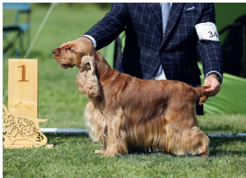
Kokeršpaniel zlatý

Po dovŕšení 12 mesiacov veku je potrebný röntgen na dyspláziu bedrových kĺbov s výsledkom maximálne C/C.