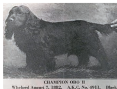
Obo II