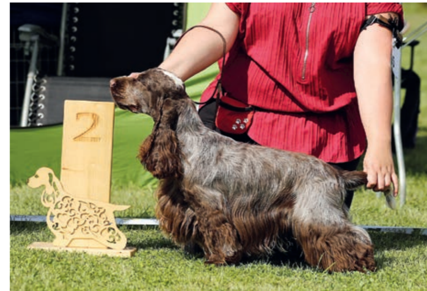
Kokeršpaniel hnedý beloš, snímka: Jana Kadnárová