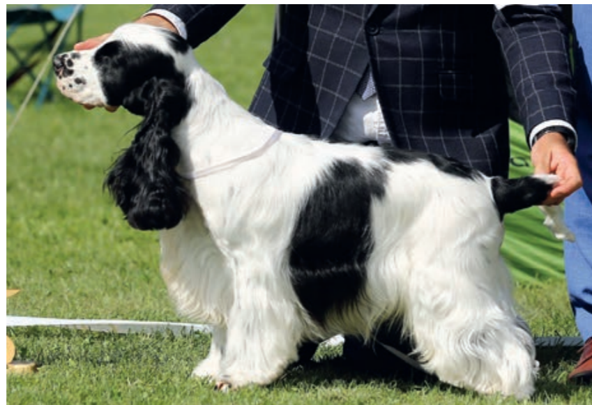
Kokeršpaniel bieločierny

Musí absolvovať minimálne tri výstavy po dovŕšení 12 mesiacov veku (z toho jedna je povinná klubová výstava) s ocenením „výborný“ u psa a „veľmi dobrý“ u sučky.