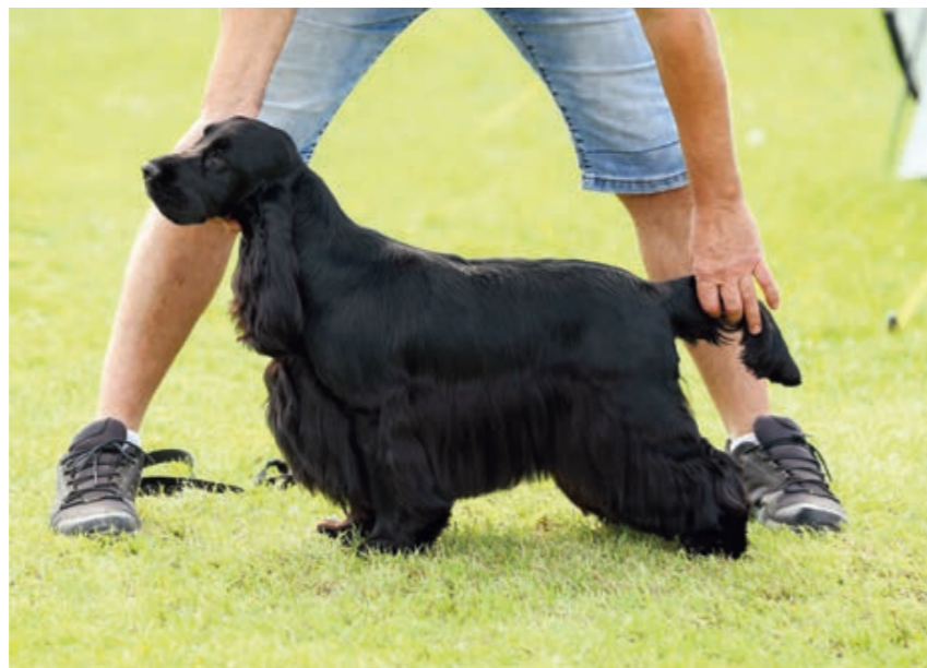
Kokeršpaniel čierny