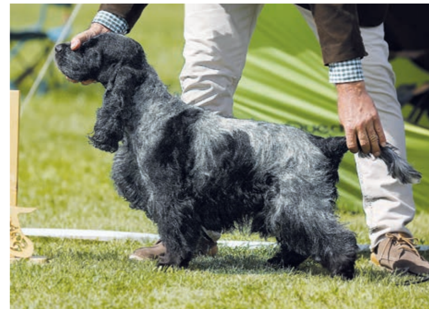
Kokeršpaniel modrý beloš