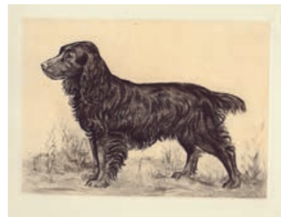
Obo I

Dr. John Caius (1510—1573) napísal, že všetky španiele boli buď biele s čer-