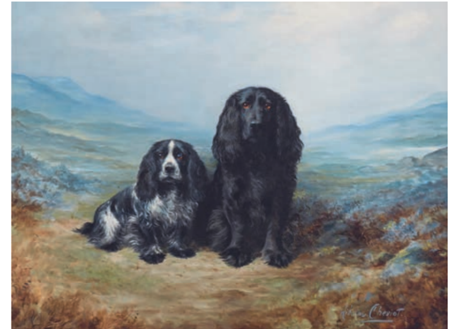
Kokeršpaniel v umení

Nos: dostatočne široký, aby zaistil výborný čuch.