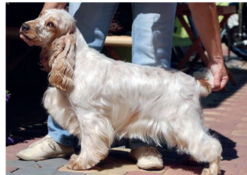
Kokeršpaniel oranžový beloš

chýlky od hore uvedeného a akékoľvek telesné abnormality a poruchy správania.