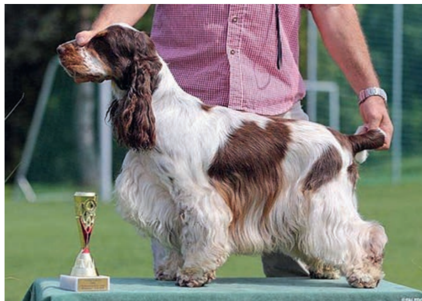
Kokeršpaniel hnedý beloš s pálením