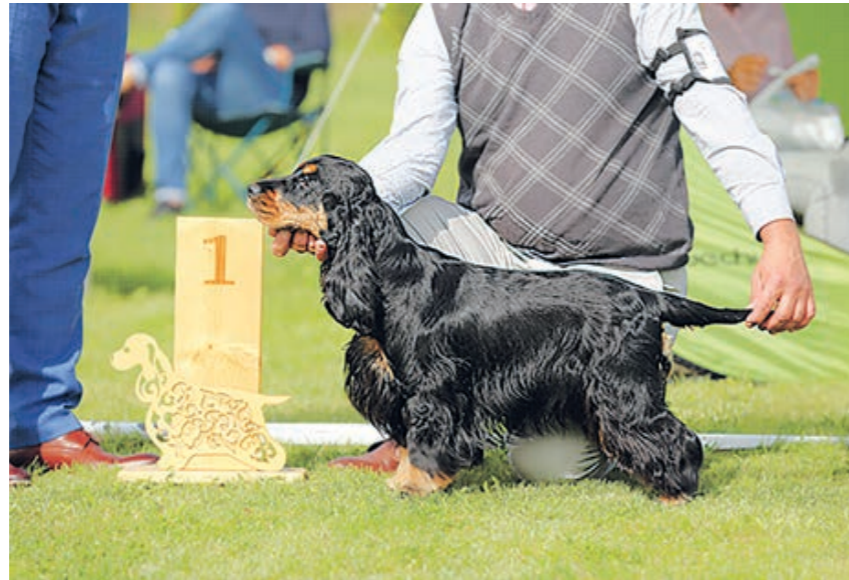
Kokeršpaniel čierny s pálením

Diskvalifikovaný musí byť každý pes, u ktorého sa objavia akékoľvek od-